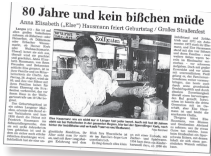
„80 Jahre und kein bißchen müde“ Artikel, 1998.